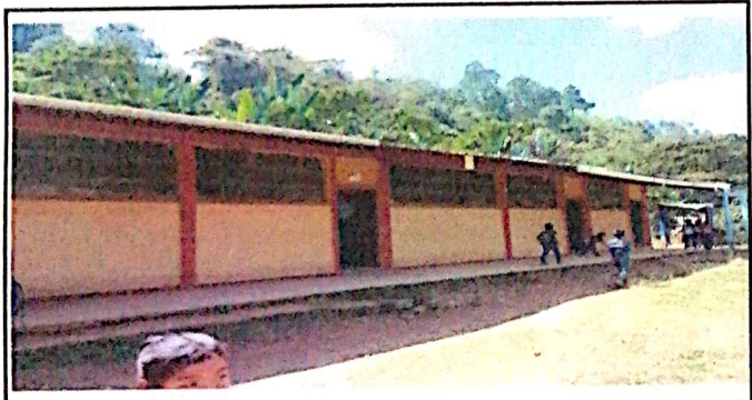
Foto 3: sustituciones de ventanas de vidrio por ventana balcones de metal