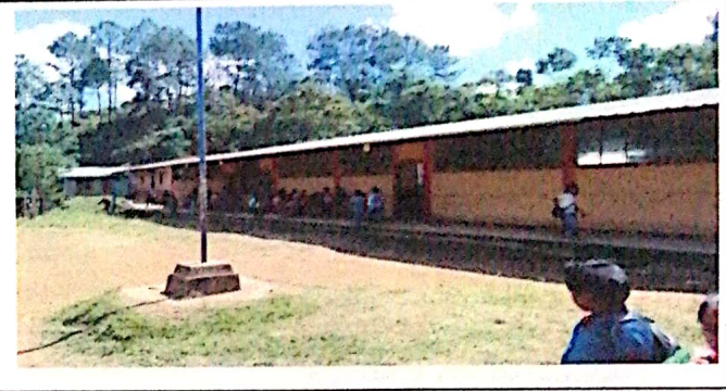
Foto 4: Sustitucion de pintura existente con pintura nacionales del color de Bandera.